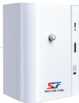
(Basic 400 ml)